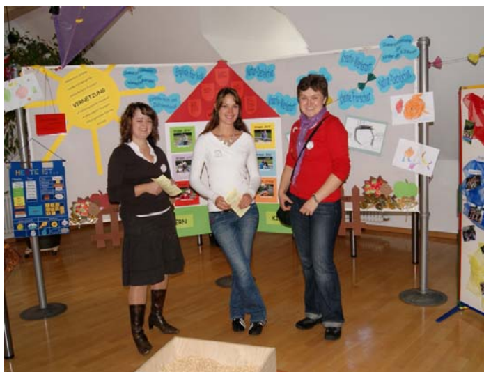
Der Kindergarten St. Josef war bei der Familienmesse im Sitzungssaal des Rathauses mit vertreten.

Zahlreiche Vereine, Gruppierungen und Institutionen nahmen daran teil und gaben den Besuchern einen kleinen Einblick in die ehrenamtliche Arbeit. Von den ganz Kleinen der Mutter-Kind-Gruppe bis hin zu den Senioren mit dem Seniorenclub und Seniorenstammtisch war ein breites Angebot gegeben.