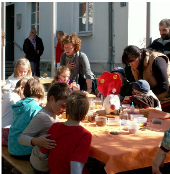
Die kleinen Gäste bastelten eifrig am Rathausvorplatz.

Für die kleinen Besucher wurden vom OGV Unterbuchfeld und den kinderbetreuenden Einrichtungen im Rathaus Spielmöglichkeiten angeboten.