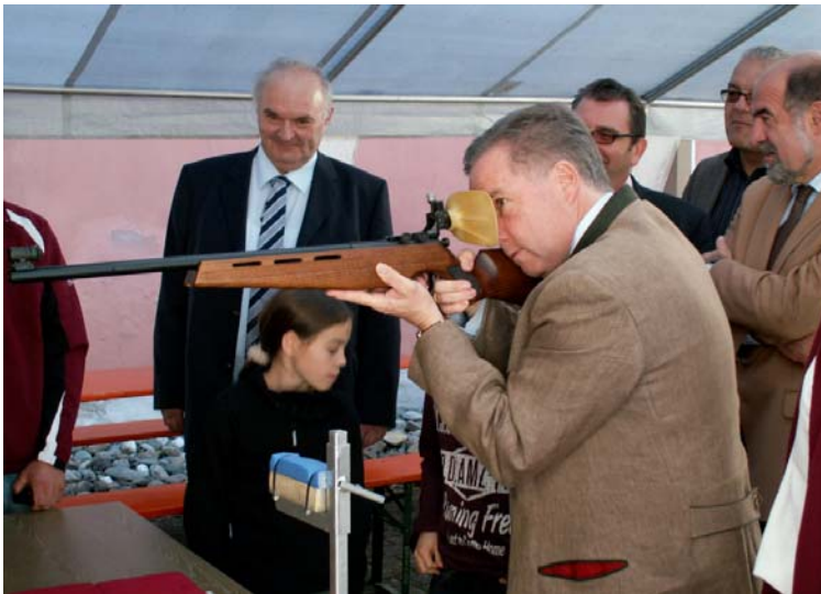
Auch der Staatssekretär schnupperte in den Sport den „Schießens“.