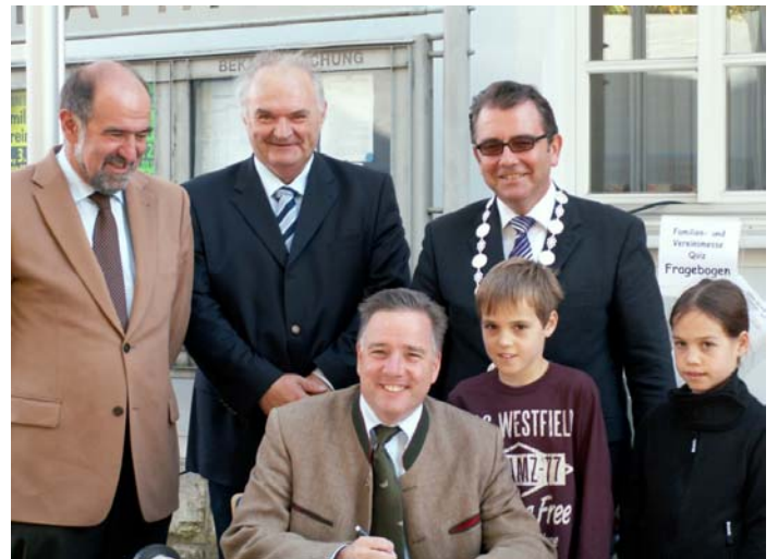
Der Staatssekretär Markus Sackmann zusammen mit seinen beiden Kindern beim Eintrag in das Goldene Buch der Gemeinde Deining.