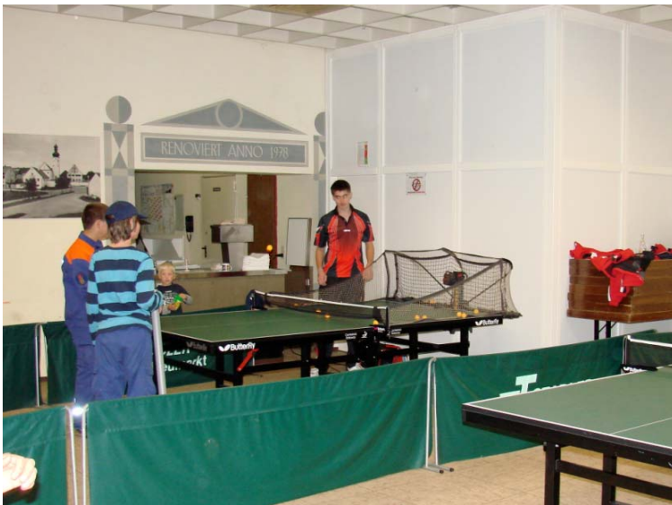
Der Tischtennisverein des 1. FC Deining stellte im Pfarrheim seine Tische auf, damit ordentlich gespielt werden konnte.

Insgesamt gesehen war der Naturmarkt mit der Familien- und Vereinsmesse 2010 wieder ein voller Erfolg. Viele Besucher schlenderten durch den Markt und die Messe.