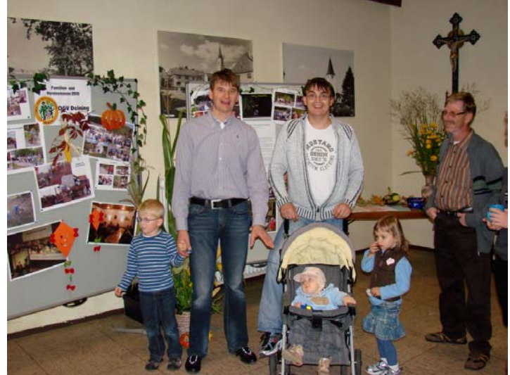
Zahlreiche Familien besuchten die Familien- und Vereinsmesse 2010.

Egal ob Leckereien der OGV's, Wein von unserer Partnergemeinde in Niederösterreich oder Informationen über Vereine, etc. – ein umfangreiches Programm wurde angeboten.