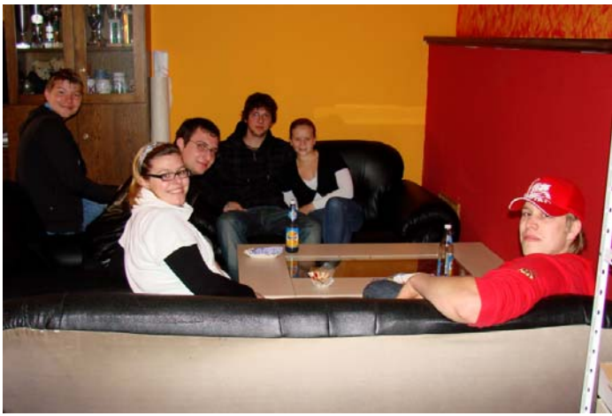
Ein Teil der Mitglieder der KLJB Deining im Gruppenraum des Deining Pfarrheims.

Beim diesjährigen Naturmarkt mit der Familien- und Vereinsmesse war für die gesamte Familie vieles geboten.