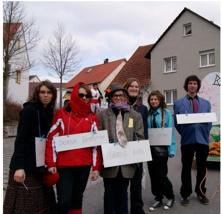
Auch die Deinger „Gemeinderäte“ waren fleißig beim Faschingsumzug mit vertreten.