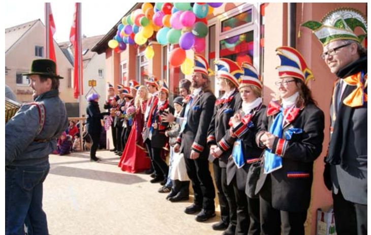
Der Faschingsverein Deining.