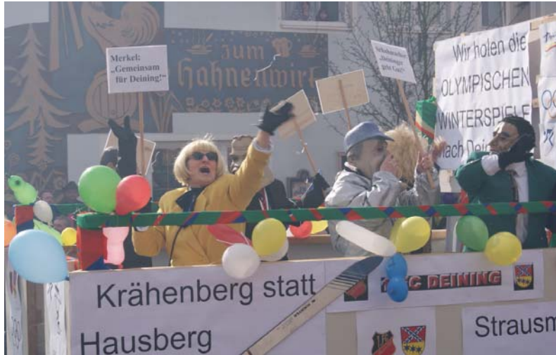
Der 1. FC Deining war mit den Olympischen Winterspielen für 2012 beim Faschingsumzug mit dabei.

Einige Eindrücke vom diesjährigen Faschingsumzug geben die nachfolgenden Bilder: