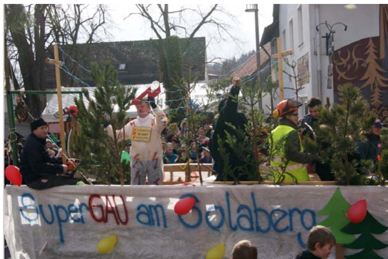
Die Siegenhofener waren mit dem Supergau auf dem Solaberg unterwegs.